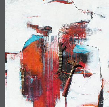
Renate Moser Bilder

Für mich ist die Malerei ein Ausdruck der täglichen Inspirationen, die mich beflügeln oder beschäftigen. Mit verschiedenen Materialien erschaffe ich die Grundlagen für die Bildgestaltung. Ich arbeite meist mit Acrylfarben, Collagen, Asphalt und Zement. Auch Rostteile oder alte Werkzeuge haben ihren Platz in meinen Bildern.