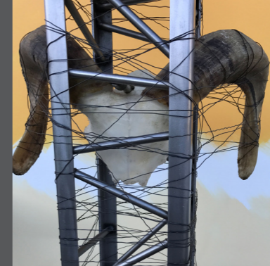
Reto Baumann Eisenskulpturen

Meine Skulpturen entstehen aus Eisenschrott, ausgedienten Teilen, Abfallstücken und Restprodukten. Auch Fundstücke aus Ferienreisen und Schrottplatz-Trouvaillen mit den unterschiedlichsten Formen und Oberflächen werden mit weiteren Materialien, wie Holz und Acrylglas kombiniert. So entstehen immer wieder faszinierende und oft auch skurrile Objekte.