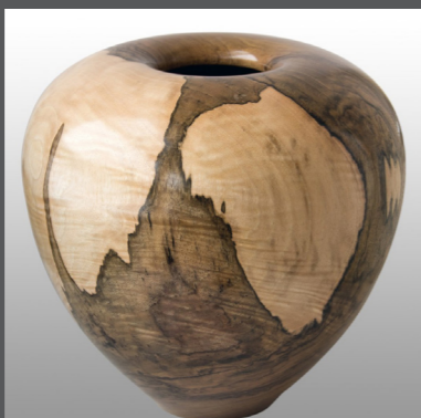
Hannes Piringer Drechslerarbeiten

Ich bin Österreicher und lebe seit 25 Jahren in Beinwil am See. In meiner Werkstatt mit Blick über den Hallwilersee kann ich meine Kreativität entfalten. Die Natur ist eine großartige Künstlerin, sie schafft abstrakte Formen, faszinierende Texturen und ungewöhnliche Farbenspiele. Ich arbeite gerne mit Holz und versuche durch möglichst einfache Formgebung die Kunstwerke der Natur noch besser zur Geltung zu bringen.